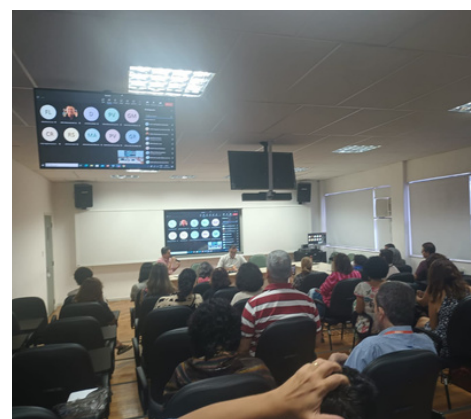
Candidato Mário Moreira na ENSP.

O documento na íntegra disponibilizamos nas próximas páginas.