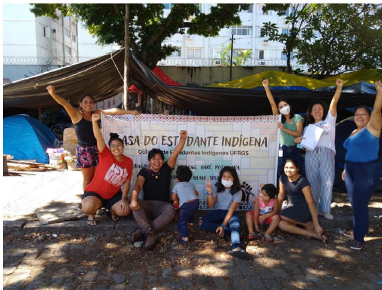
Figura 1 – Coletivo de Estudantes Indígenas da UFRGS