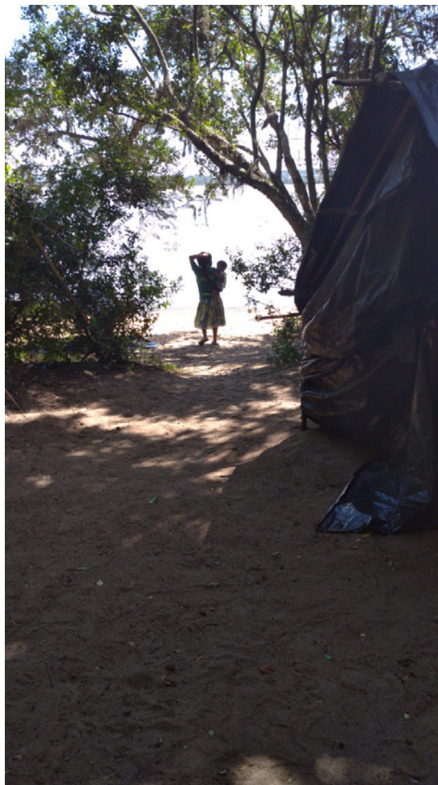
Figura 3 – Mulher indígena Mbyá-Guarani, com criança no colo, nas margens do Lago Guaíba, na tekoá Yjeré, retomada Mbyá-Guarani da Ponta do Arado