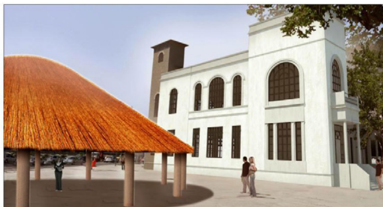
Figura 5 – Estudo preliminar de restauro do antigo prédio, realizado por uma agência de arquitetura, como apoio voluntário à luta pela criação do Centro de Referência da Cultura Viva dos Povos Indígena

Fonte: AAA Azevedo Agência de Arquitetura.