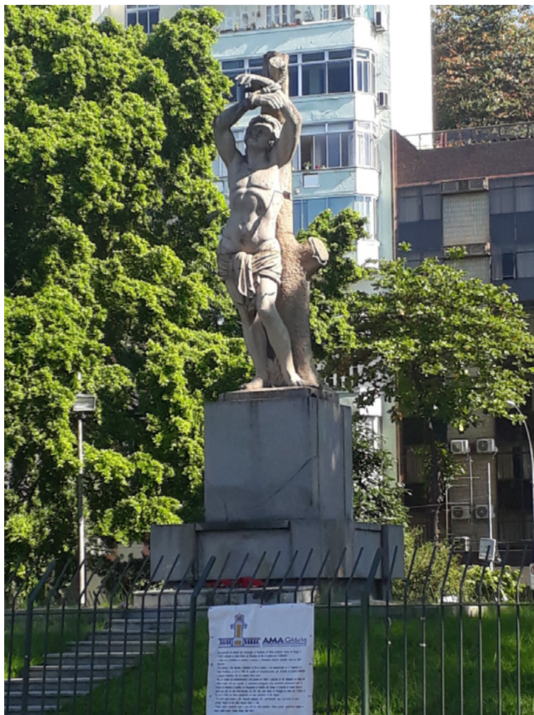
Figura 1 – Monumento na praça Luís de Camões, aos pés do Outeiro da Glória, onde ficava parte da grande aldeia Karióka, do líder Aimberê