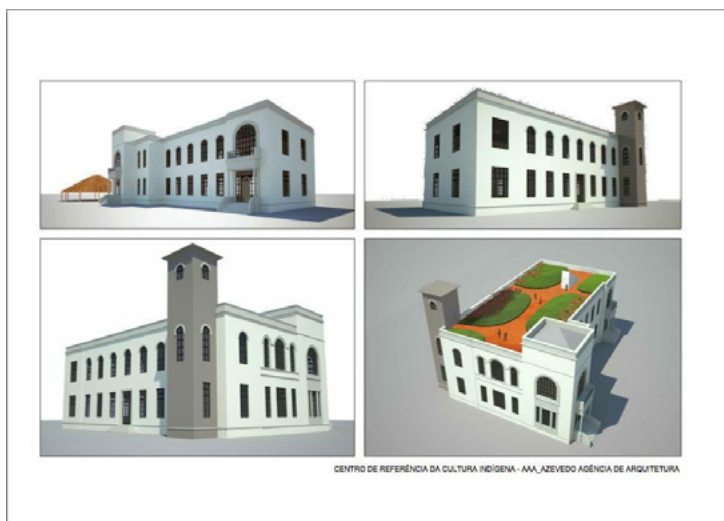
Figura 4 – Estudo preliminar de restauro do antigo prédio, realizado por uma agência de arquitetura, como apoio voluntário à luta pela criação do Centro de Referência da Cultura Viva dos Povos Indígena