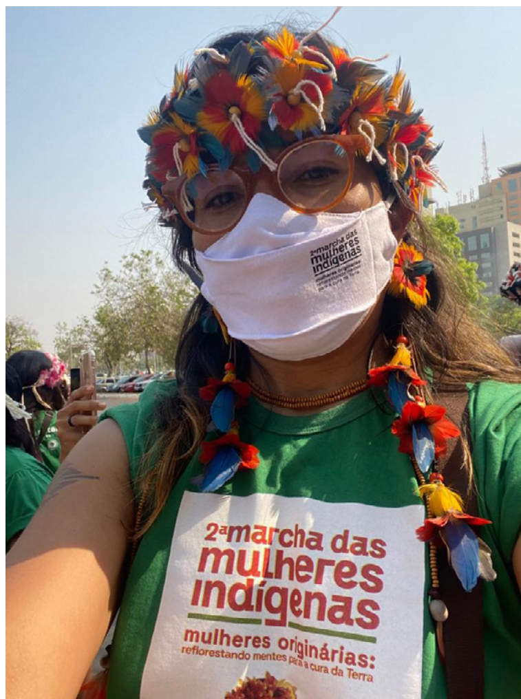
Figura 1 – 2ª Marcha das Mulheres Indígenas