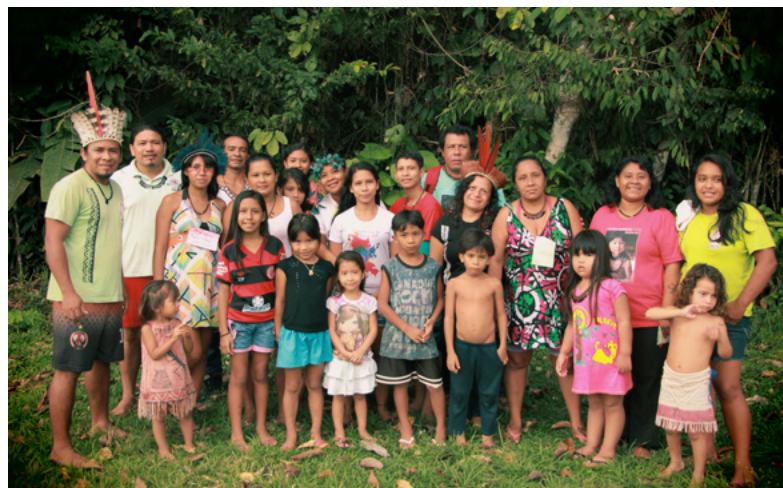
Figura 2 – Indígenas da etnia Sateré-Mawé. Integrantes da Coordenação dos Povos Indígenas de Manaus e Entorno (COPIME). Cidade de Manaus (AM).