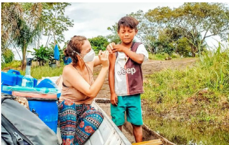
Figura 2 – Vacinação entre os Yudja e Kawaiwete