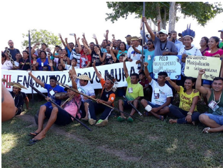
Figura 1 – Encontro do Povo Mura (2019). Território Mura de Careiro da Várzea até a ponta de Autazes-AM