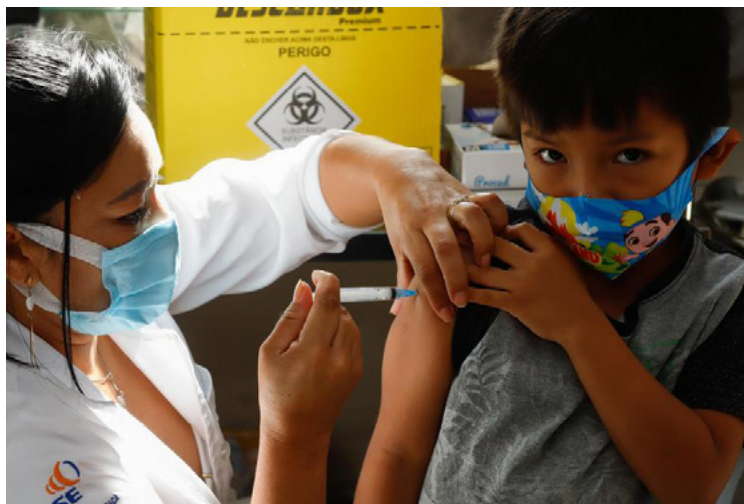
Figura 1 – Vacina contra Covid-19, de menino kaingang