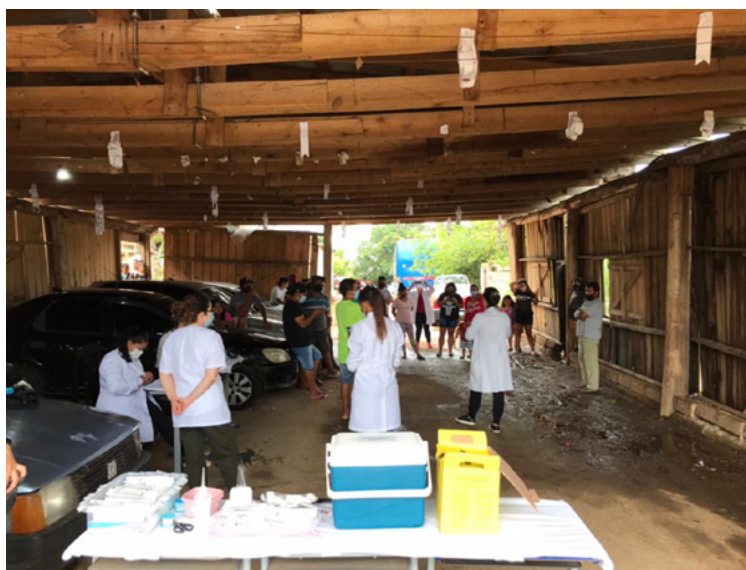
Figura 2 – Equipe Multidisciplinar de Saúde Indígena (EMSI), na aldeia Kaingang Tupe pen, Morro do Osso, Porto Alegre