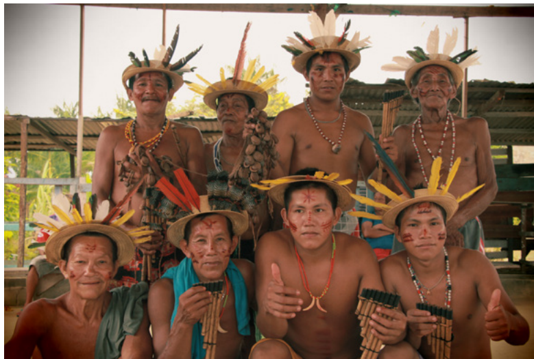
Figura 1 – Indígenas das etnias Tuyuka e Tukano. Integrantes da Associação Cultural Indígena do bairro Tiago Montalvo. Cidade de São Gabriel da Cachoeira (AM).