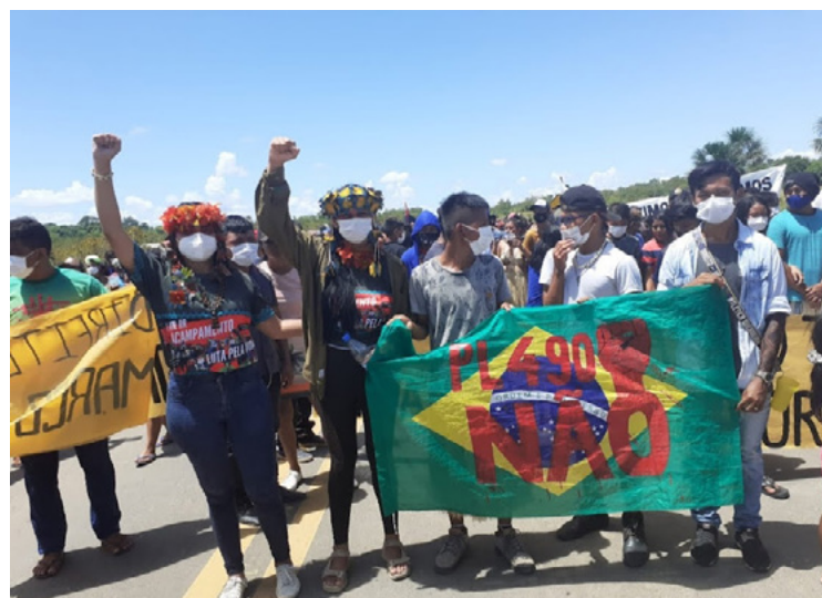
Figura 2 – Manifestação contra o PL 490 / Marco Temporal, 2021