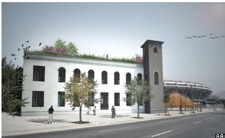
Figura 3 – Estudo preliminar de restauro do antigo prédio, realizado por uma agência de arquitetura, como apoio voluntário à luta pela criação do Centro de Referência da Cultura Viva dos Povos Indígena