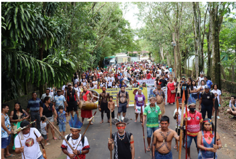
Figura 1 – Marcha pela Retomada Coletiva do Movimento Indígena do Amazonas/Manaus, 31 de março de 2022