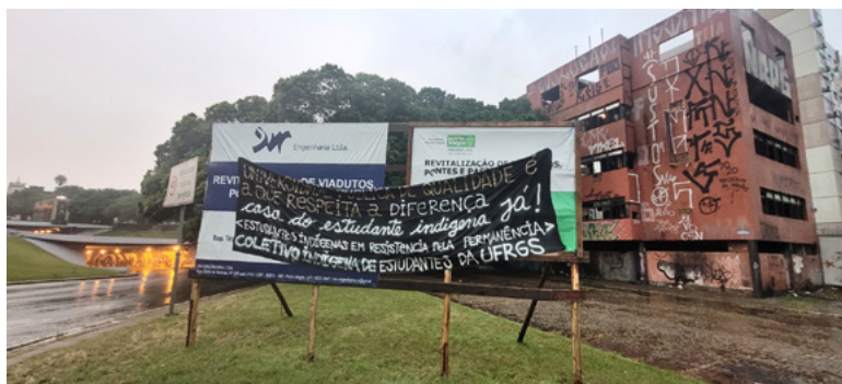
Figura 2 – Retomada da Casa do Estudante Indígena