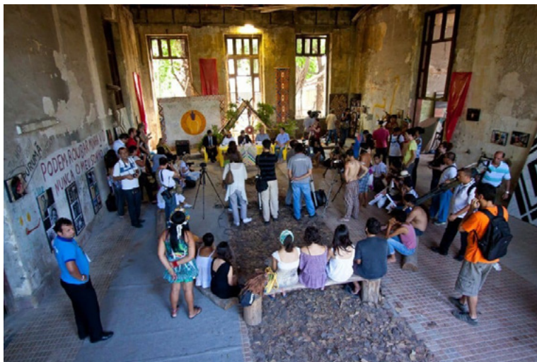
Figura 1 – Mobilização pela transformação do antigo prédio do Museu do Índio em um Centro de Referência da Cultura Viva dos Povos Indígenas