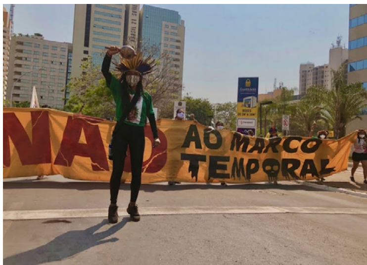
Figura 1 – Manifestação contra o PL 490 / Marco Temporal, 2021