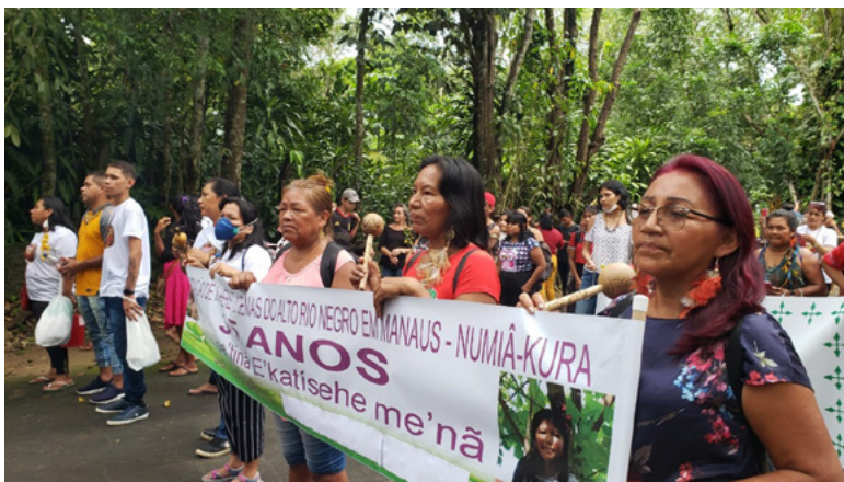
Figura 2 – Marcha pela Retomada Coletiva do Movimento Indígena do Amazonas/Manaus, 31 de março de 2022