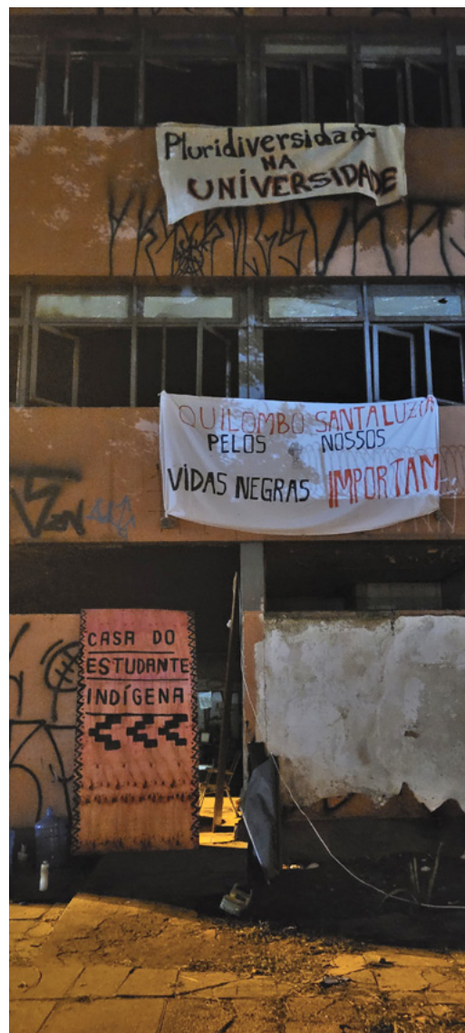
Figura 1 – Retomada da Casa do Estudante Indígena