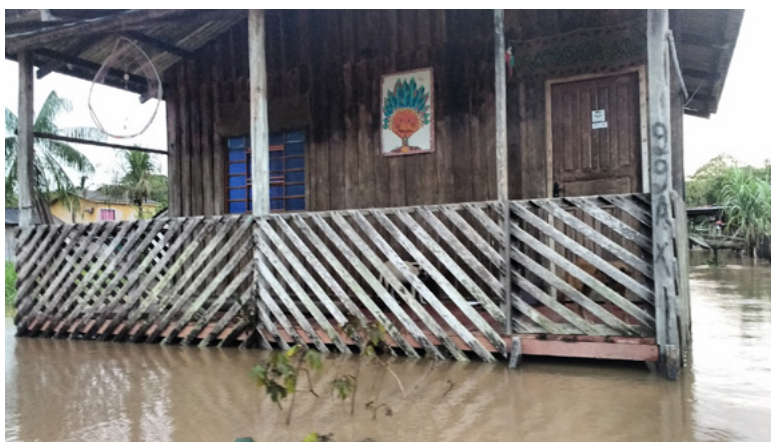
Figura 2 – Espaço cultural Maloca Mura no distrito de Nazaré. Inundação em 2019