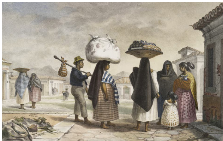
Figura 1 – Lavadeiras indígenas no Catete/RJ

Fonte: Debret, Voyage pittoresque et historique au Brésil, 1834.