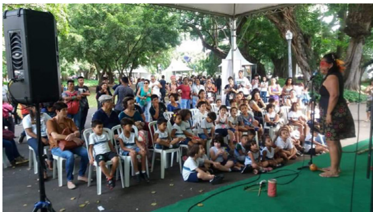
Figura 1 – Contação de histórias e lendas indígenas, 2019