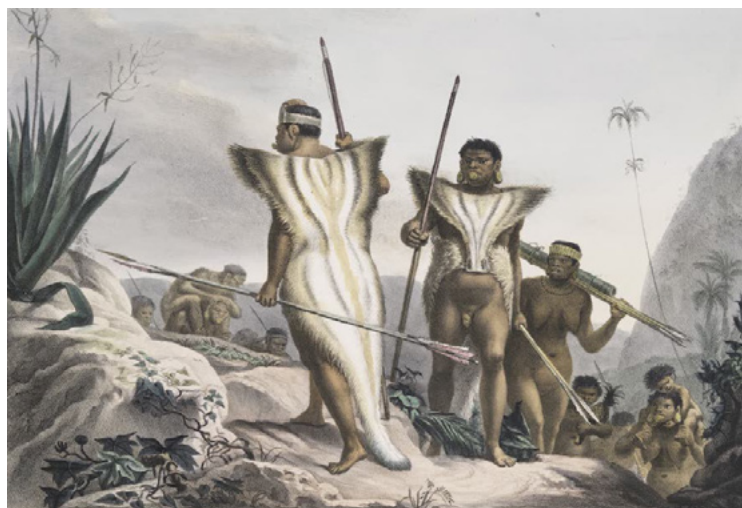
Figura 2 – Família Botocudo que esteve na corte para a cerimônia do beija-mão com D. João

Fonte: Debret, Voyage pittoresque et historique au Brésil, 1834.