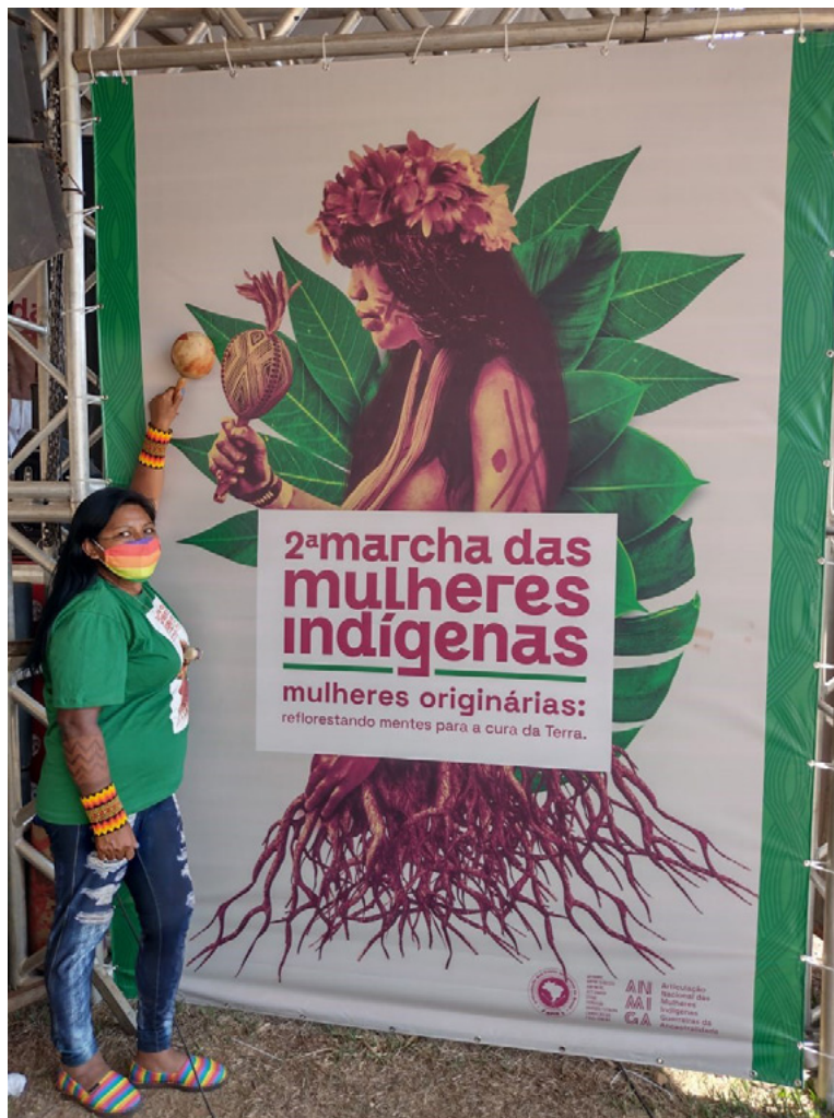
Figura 1 - 2ª Marcha das mulheres indígenas. Mulheres originárias: reflorestando mentes para a cura da Terra