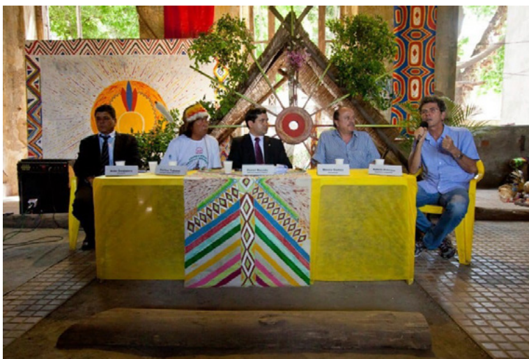
Figura 2 – Mobilização pela transformação do antigo prédio do Museu do Índio em um Centro de Referência da Cultura Viva dos Povos Indígenas

Foto de Acervo Pessoal de Carlos Tukano, 2013.