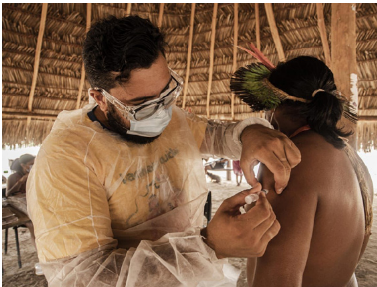
Figura 1 – Vacinação entre os Kisêdjê