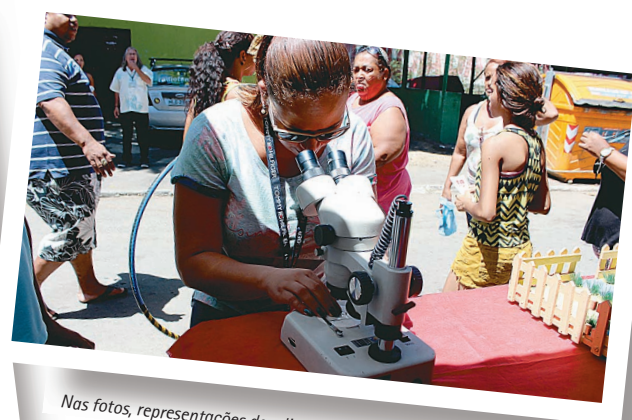
Nas fotos, representações das diversas instituições e moradores que participam das ações coletivas contra o Aedes.

"Estamos considerando espaços densamente povoados, com aproximadamente 40 mil moradores distribuídos em 15 sublocalidades, entre favelas e conjuntos habitacionais, algumas com os piores Índices de Desenvolvimento Humano do Estado do Rio de Janeiro e em situ-