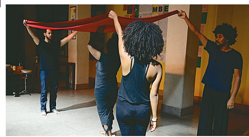
Agenda Cultural Mandela Vive!